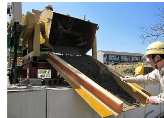
運搬車・一輪車積込