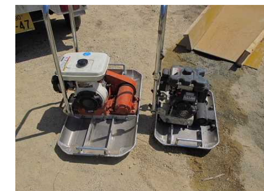
ランプレート 大 小