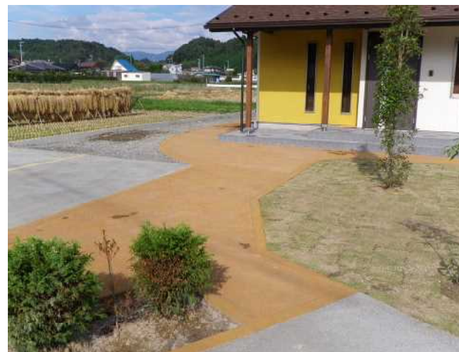
住宅駐車場・アプローチ施工