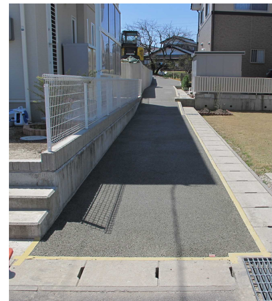
住宅間の歩道施工