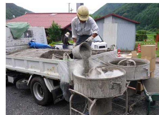
3切以上のミキサー練り