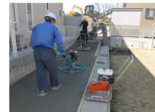
ランプレート転圧+土間均機