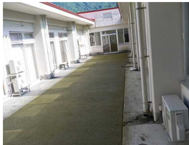
老人ホーム中庭施工