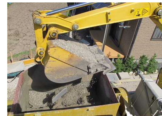
大型ミキサー (200ℓ) ミキサーでの練り